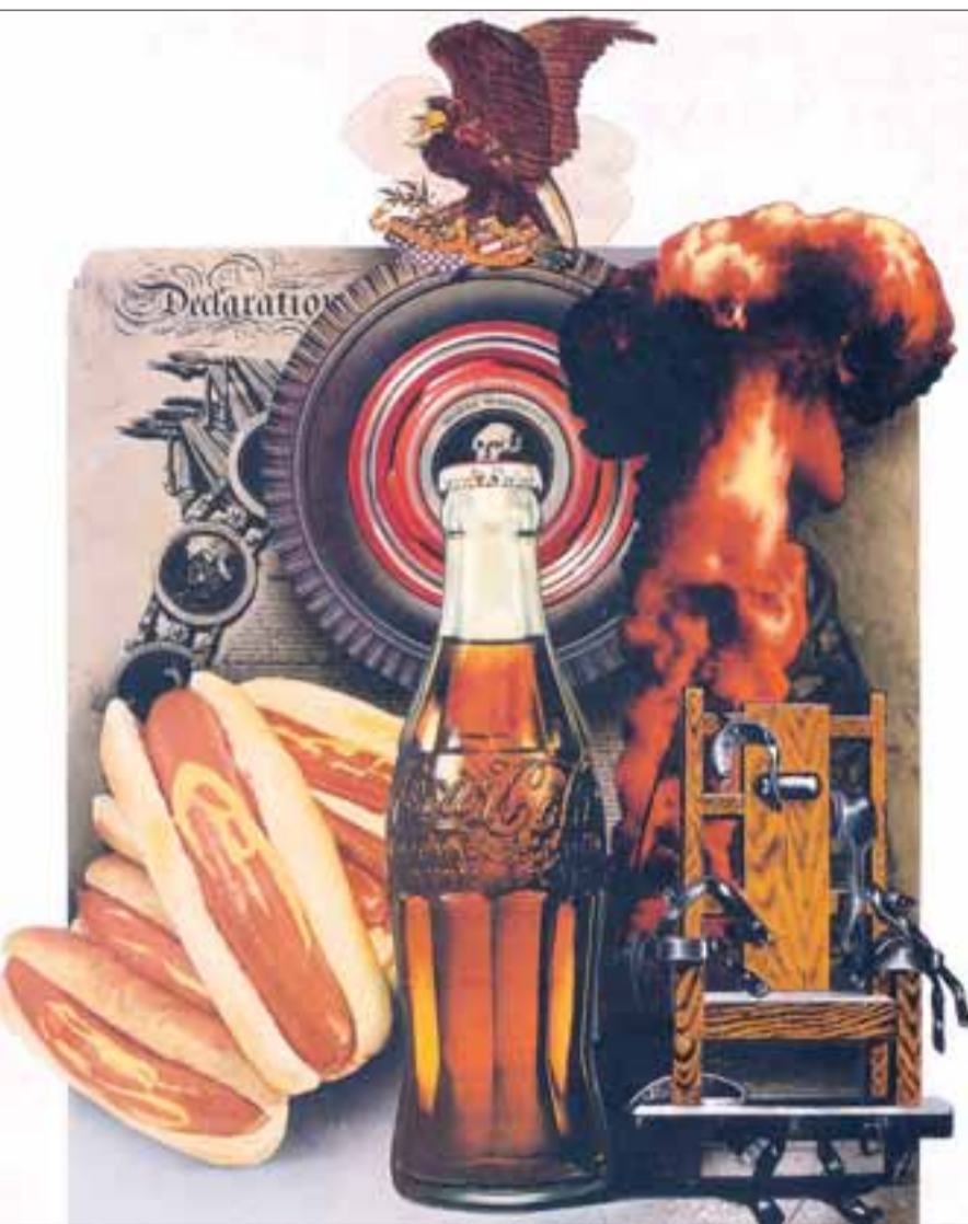
Josep Renaus Sicht auf die USA: „American Celebrities“, 1956 bis 1965, aus der 1967 veröffentlichten Serie „The American Way of Life“.

Das Instituto Cervantes zeigt Arbeiten des spanischen Graphikdesigners Josep Renau