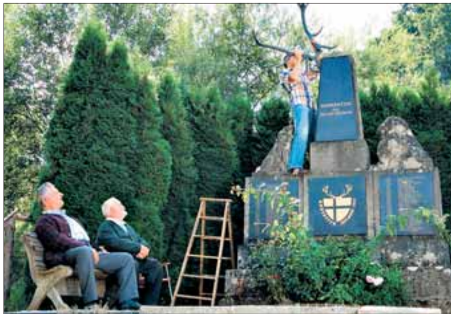
Wenn es darum geht, einen alten Brauch neu zu erfinden, scheint ein Hirschgeweih auf dem Kriegerdenkmal eine geeignete Maßnahme zu sein.

Ein Sendetermin steht noch nicht fest. Die dezente Hoffnung, dass „Das große Hobeditzn“ vom Filmfest weg den Sprung in die Kinos schafft, hat Kiefersauer noch nicht ganz begraben, darüber wagt er aber im Gespräch kaum zu spekulieren. Derweil bereitet er seinen nächsten Fernsehfilm vor: „Baching“, dessen Buch in der Drehbuchwerkstatt entstand und mit dem Tankred-Dorst-Preis ausgezeichnet wurde. Rosenmüllers Schublade bleiben auch dabei garantiert zu. Der Film erzählt, wie ein Autounfall das Leben der betroffenen Menschen in einem oberbayerischen Dorf verändert – und ist todernst. JOCHEN TEMSCH